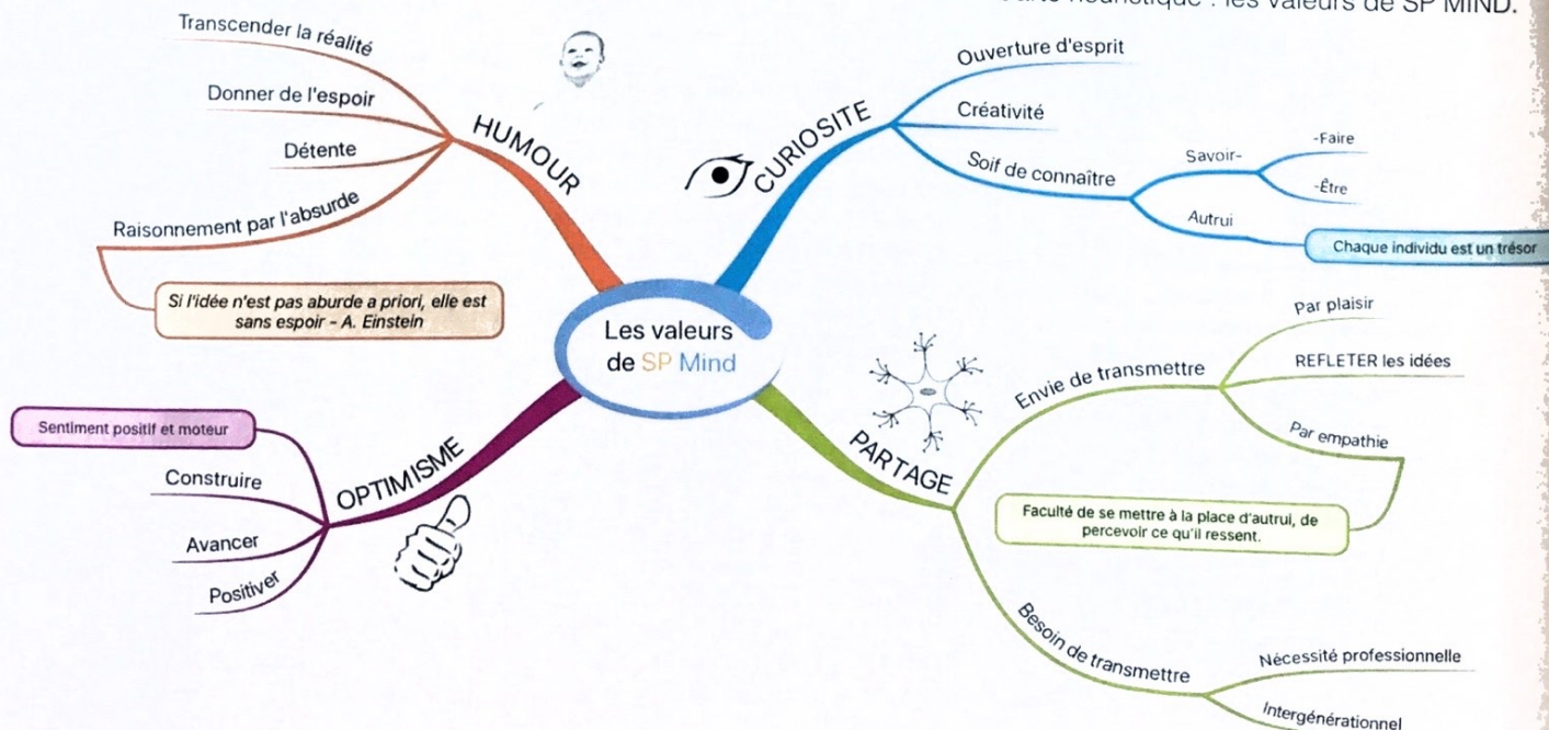
Carte heuristique : les valeurs de SP MIND.

Au fil de mes expériences, et des expériences de ceux qui m'entourent, j'ai acquis la conviction que l'empa-